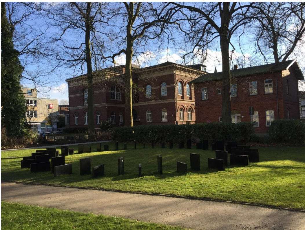
Hella Berent: Athanatos. Skulptur. Oldenburg 1995.

Bildmaterial stellen wir Ihnen gerne zur Verfügung.